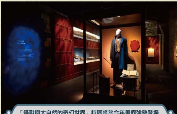
「怪獸與大自然的奇幻世界」特展將於今年暑假強勢登場英國展出內容完整移師來台，不容錯過。