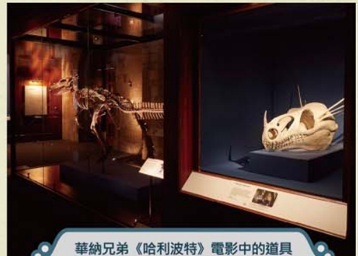
華納兄弟《哈利波特》電影中的道具與現實世界中的文物並陳展示