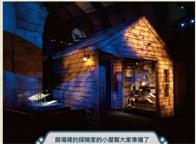
展場裡的探險家的小屋幫大家準備了各式各樣的裝備，大家一起來探險吧。